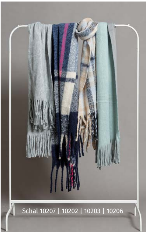
Schal 10207 | 10202 | 10203 | 10206