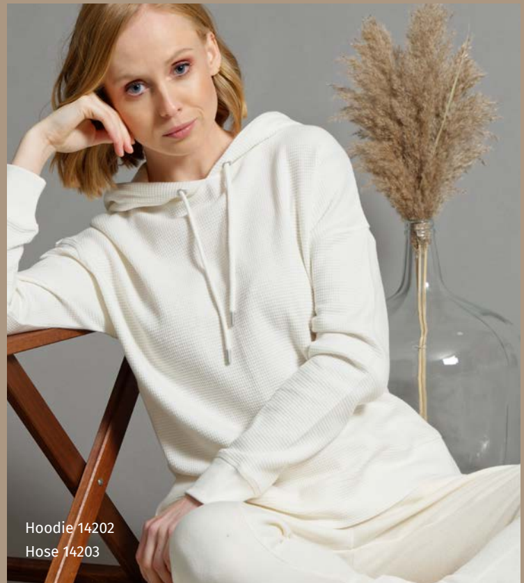
Hoodie 14202 Hose 14203