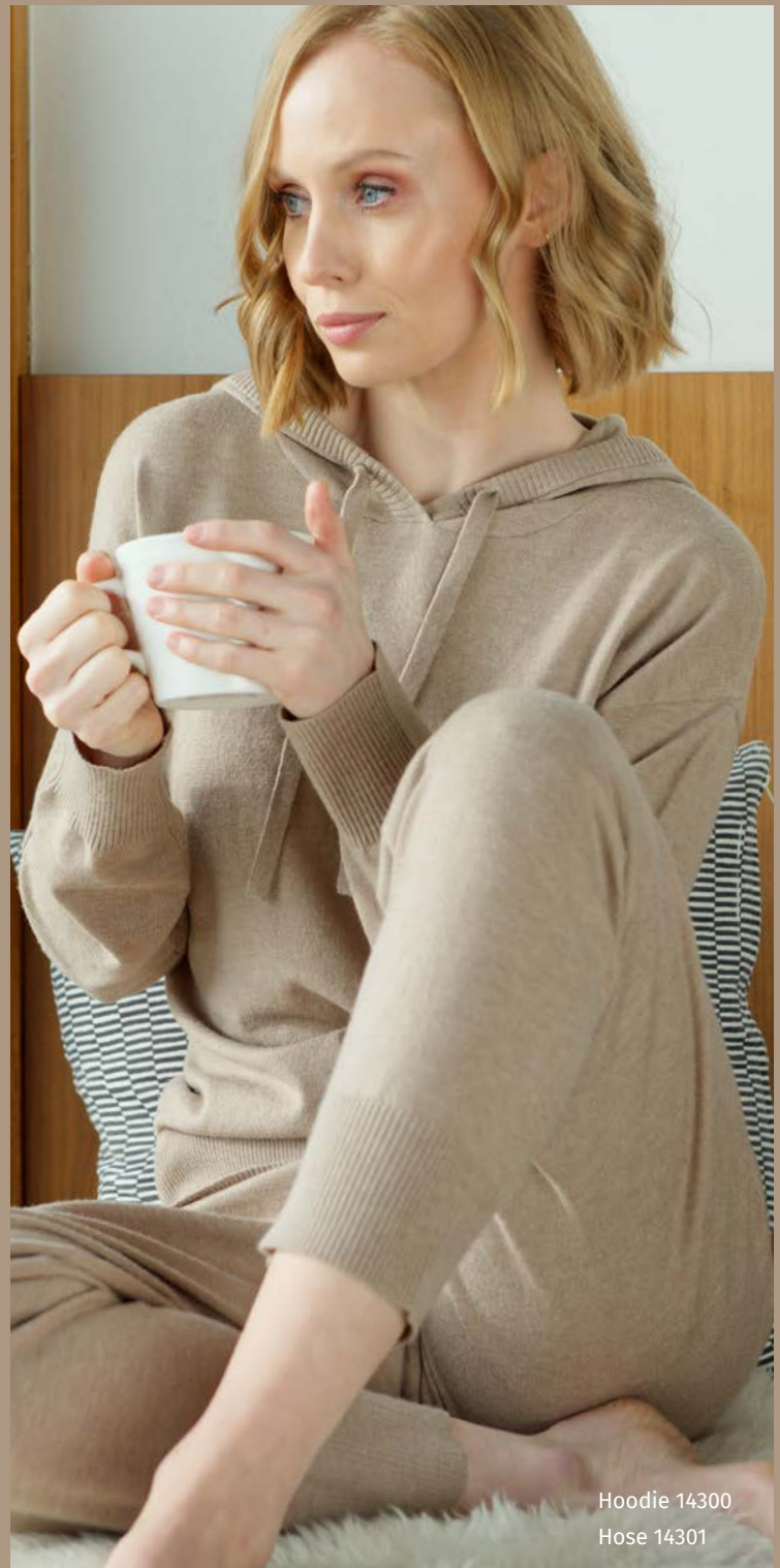
Hoodie 14300 Hose 14301