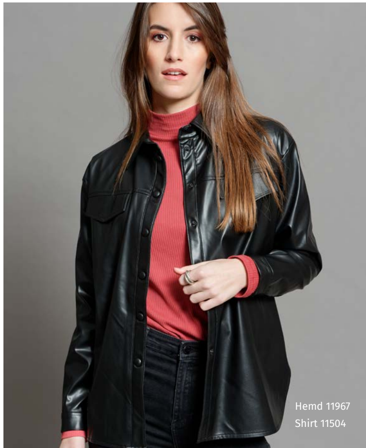
Hemd 11967 Shirt 11504