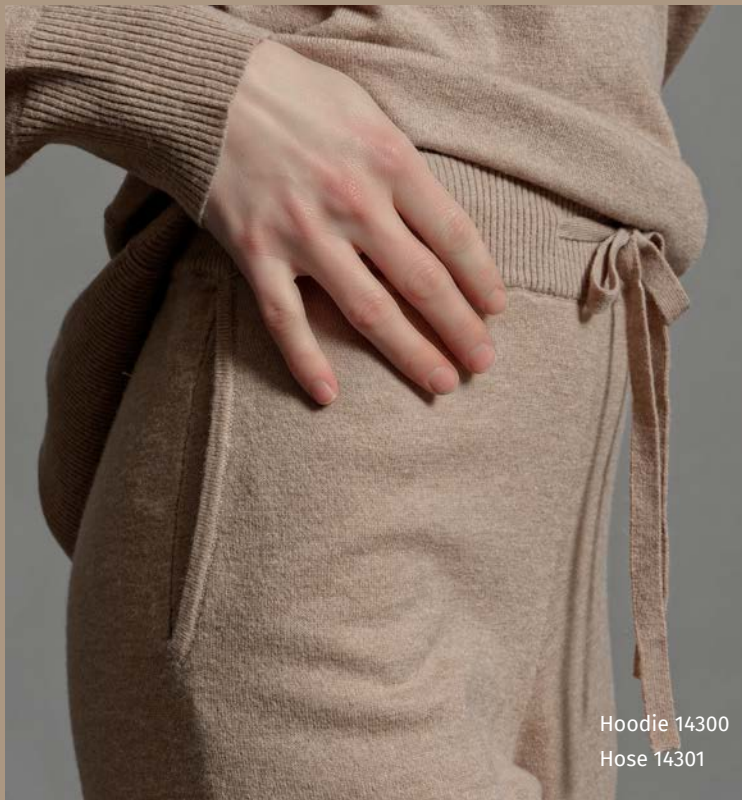
Hoodie 14300 Hose 14301