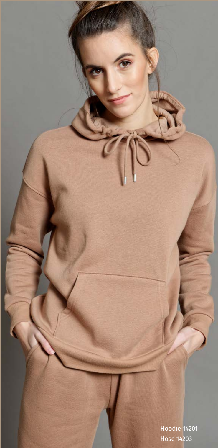
Hoodie 14201 Hose 14203